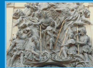
Praga, portal kościoła św. Jakuba