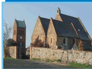
Jakubów, kościół św. Jakuba