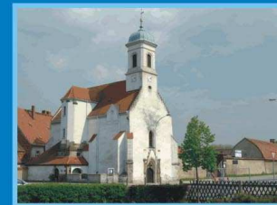
Zittau, kościół św. Jakuba

Uproszczonego schematu sieci szlaków do Santiago de Compostela na podstawie mapy z archiwum EMB, Adligenswil (Szwajcaria)