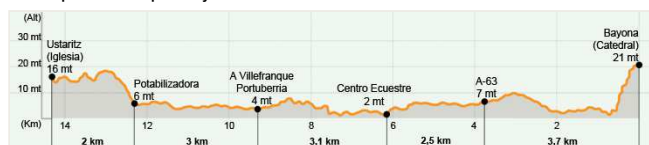
perfil de la etapa 1: Bayona - Ustaritz del Camino Baztanés