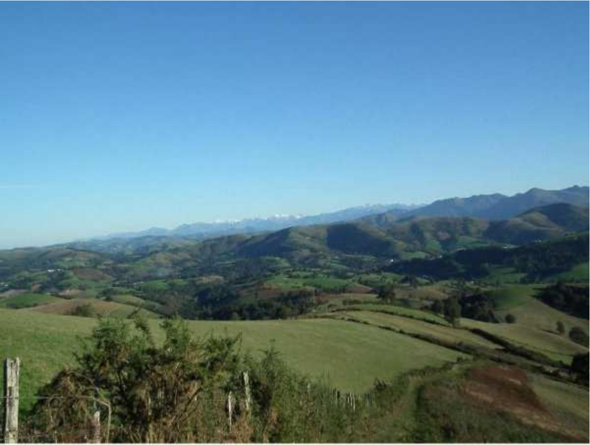
Mis à jour le dimanche 30 mars 2014