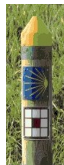
Circuit des bastides